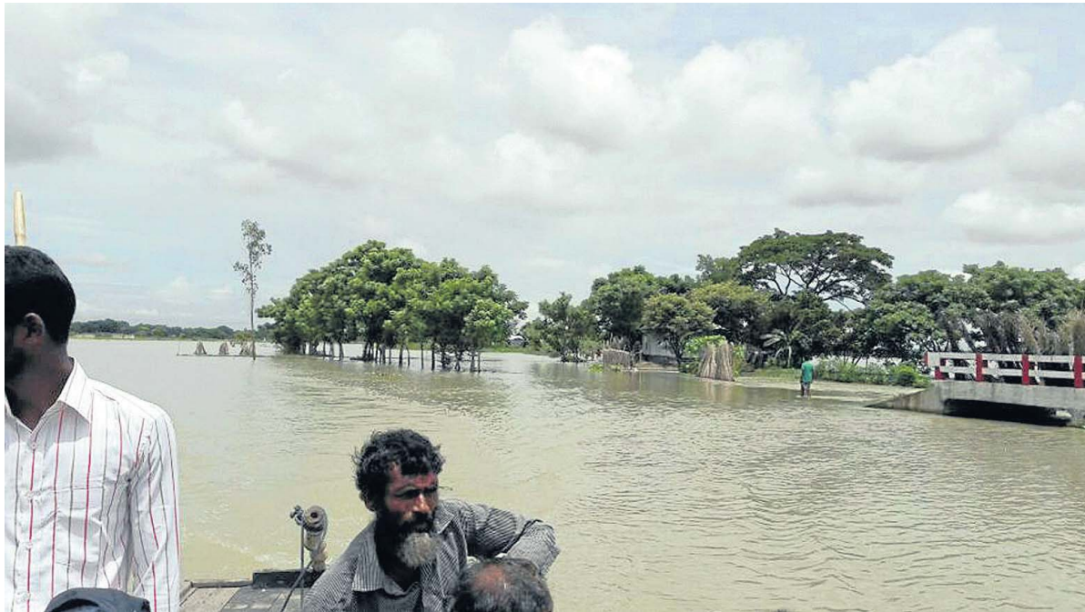
So sieht es derzeit in der Gegend um das Dorf Huzurikanda im Norden von Bangladesch aus. Das Hochwasser überschwemmt die Felder der armen Kleinbauern.