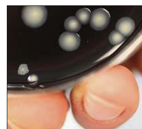
Duschen verboten im Ostdorfer Sportheim wegen Legionellen.

bleibe das Wasser länger in den Leitungen, was einen Befall fördere, so die Vermutung. Daher solle eine Vorrichtung eingebaut werden, die dafür sorgt, dass die Leitungen regelmäßig durchgespült werden, so Jürgen Luppold weiter. Er betont, dass in keiner weiteren städtischen Einrichtung Legionellen entdeckt worden seien.